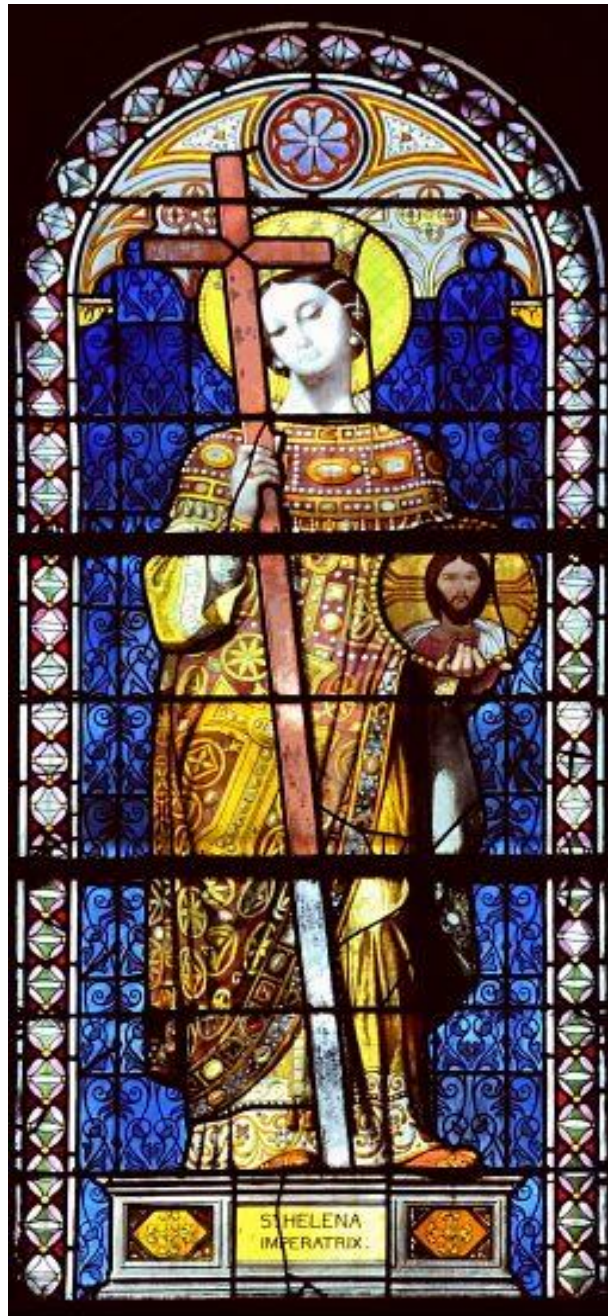
église ND de la Compassion Paris 17e

relevé par : Véronique FREMIET MATTEI source : AD Aube G44 photo : http://www.patrimoine-histoire.fr/